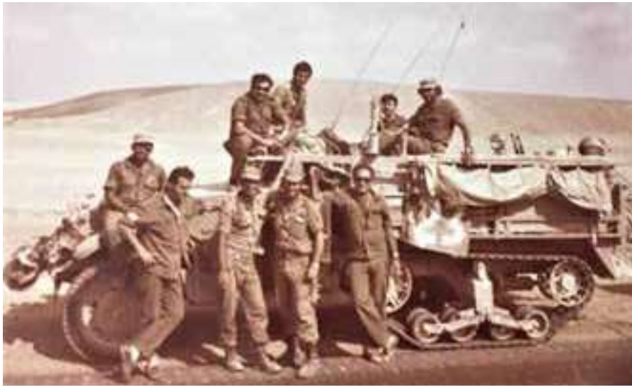
זחל"ם המודיעין של חטיבה 164

חטיבה 15 (משורינת עצמאית, של ארמייה 3), מתוגברת, תקפה לרוחב הגזרה שלנו, מציר הגידי ודרומה. טורים של טנקים ונגמ"שים חדישים הסתערו לעברנו, כשחלקם נעו לאורכו ומשני צידי הציר.